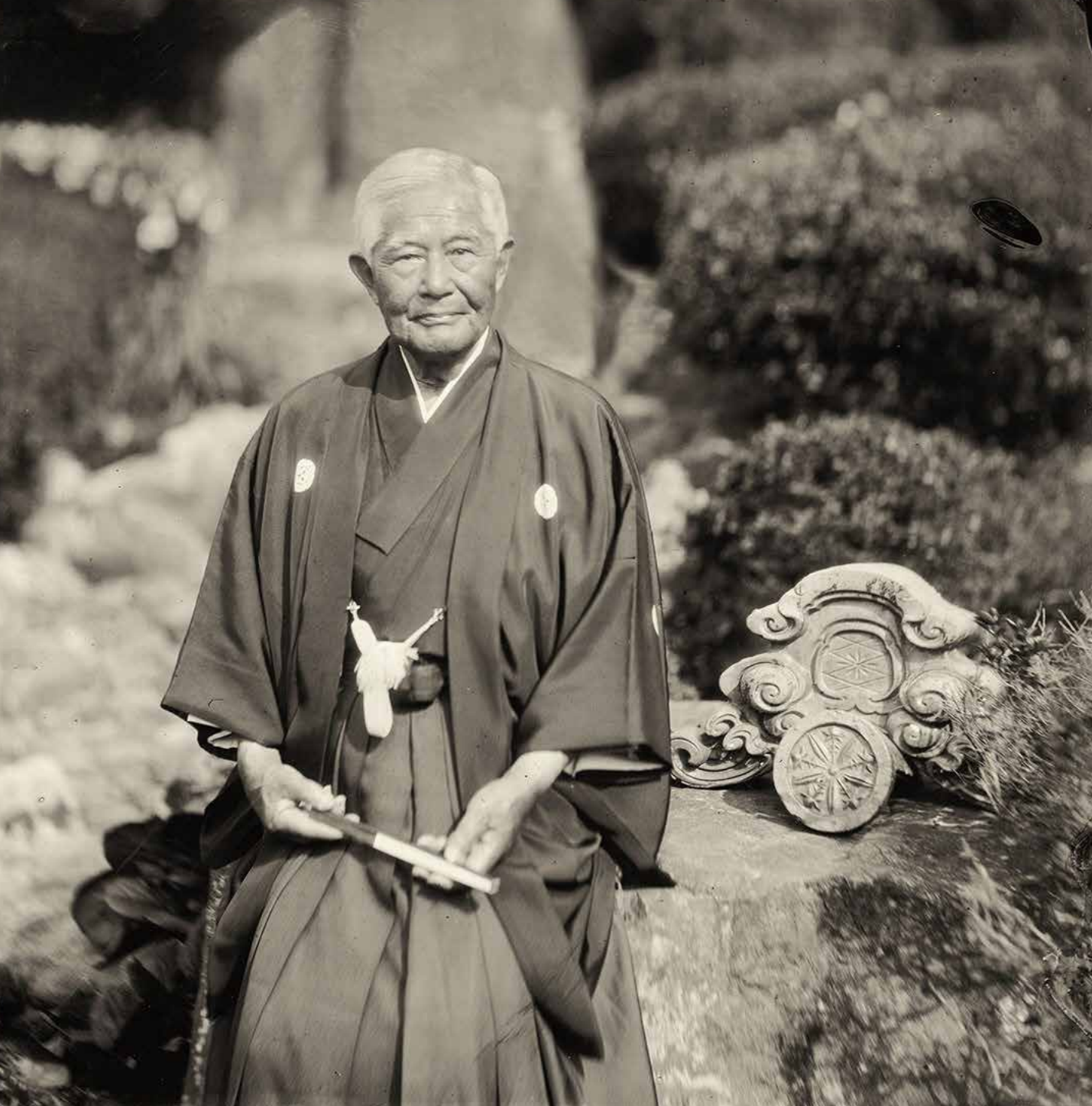
波多野氏(福井県永平寺町在住、大本山永平寺の開祖・道元禪師を越前に勧請した、鎌倉幕府幕臣の北条氏家臣・波多野義重の子孫)